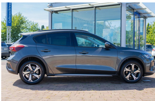
Autohaus Kreissl GmbH www.autohaus-kreissl.de