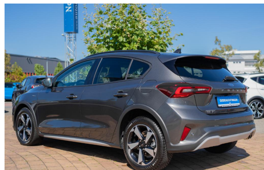
Autohaus Kreissl GmbH www.autohaus-kreissl.de