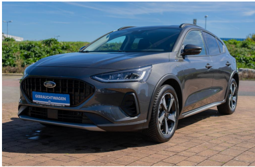
Autohaus Kreissl GmbH www.autohaus-kreissl.de