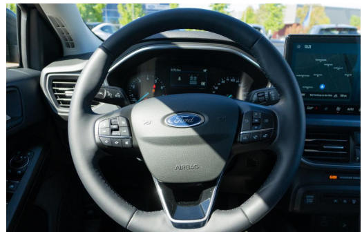
Autohaus Kreissl GmbH www.autohaus-kreissl.de