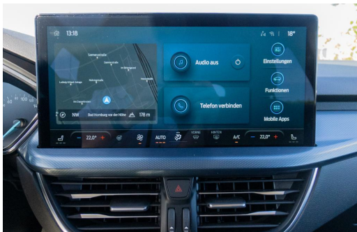
Autohaus Kreissl GmbH www.autohaus-kreissl.de