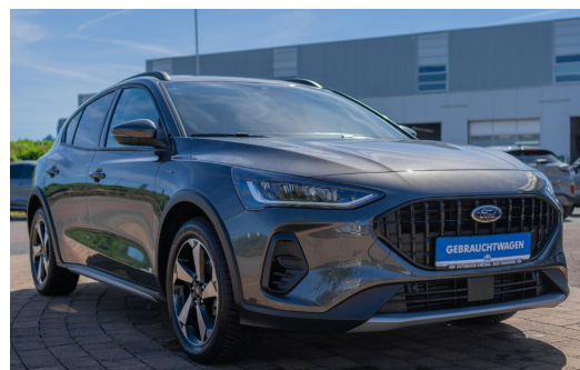
Autohaus Kreissl GmbH www.autohaus-kreissl.de