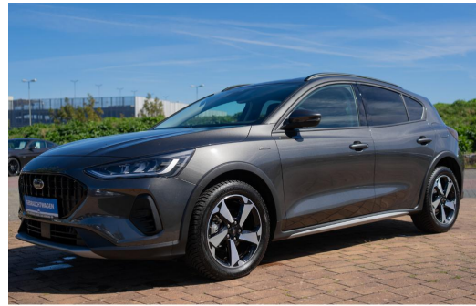
Autohaus Kreissl GmbH www.autohaus-kreissl.de