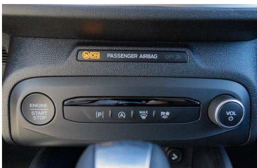
Autohaus Kreissl GmbH www.autohaus-kreissl.de

Montag - Freitag: 08:00 - 18:30 Uhr Samstag: 09:00 - 14:00 Uhr