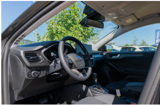
Autohaus Kreissl GmbH www.autohaus-kreissl.de