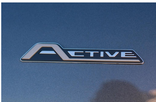
Autohaus Kreissl GmbH www.autohaus-kreissl.de