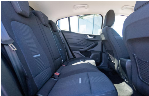
Autohaus Kreissl GmbH www.autohaus-kreissl.de