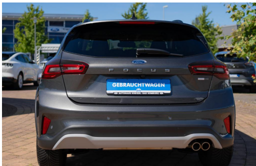
Autohaus Kreissl GmbH www.autohaus-kreissl.de