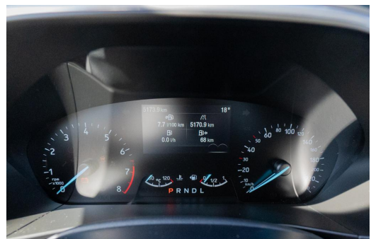
Autohaus Kreissl GmbH www.autohaus-kreissl.de