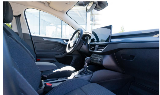
Autohaus Kreissl GmbH www.autohaus-kreissl.de