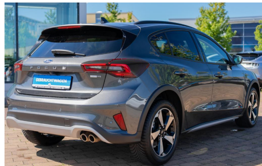
Autohaus Kreissl GmbH www.autohaus-kreissl.de