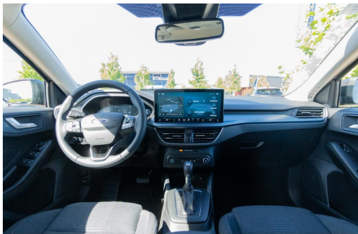
Autohaus Kreissl GmbH www.autohaus-kreissl.de