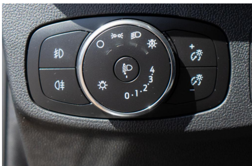
Autohaus Kreissl GmbH www.autohaus-kreissl.de