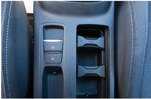
Autohaus Kreissl GmbH www.autohaus-kreissl.de