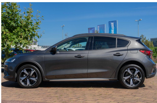
Autohaus Kreissl GmbH www.autohaus-kreissl.de