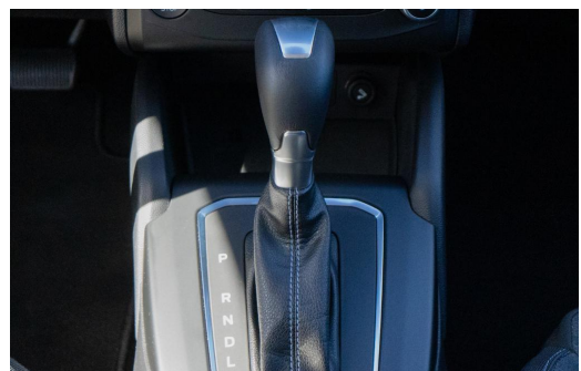
Autohaus Kreissl GmbH www.autohaus-kreissl.de